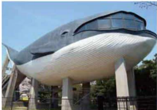
くじら館 (2000年に閉館。館内に入ること出来ません)