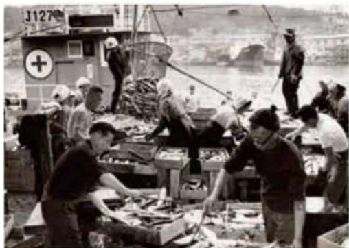
下関漁港での水揚げ (昭和40年代)