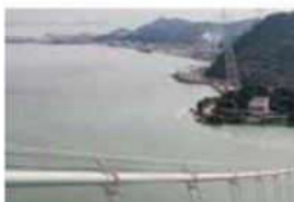
石垣が美しい住宅街