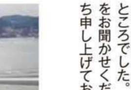
巖流島の武蔵・小次郎像