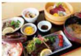
くじらづくしの定食!