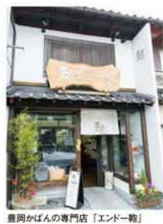
豊岡かばんの専門店「エンドー靴」