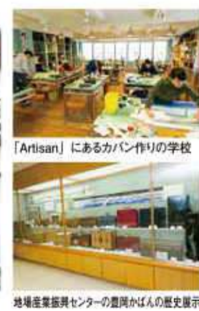
「Artisan」にあるカバン作りの学校