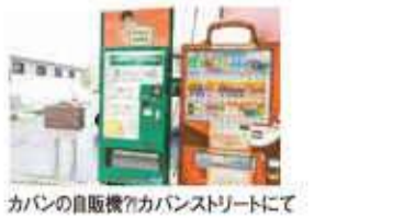
カバンの自販機「カバンストリート」にて