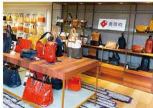
カバンストリートにある「Artisan」の展示