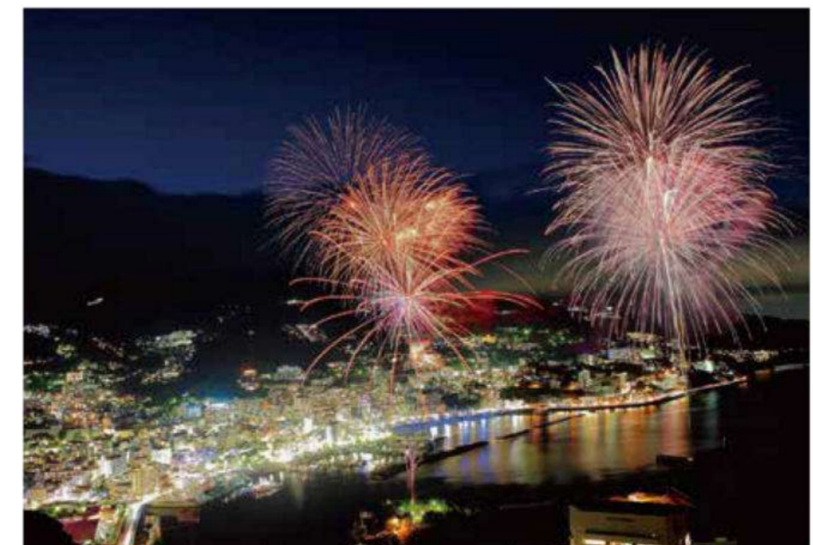
2014年 熱海海上火花大会

文芸雑誌「文藝界」を史上初の大増刷に導き、芥川賞候補にもなった大きな話題を呼んでいるピース又吉直樹の小説「火花」は、印象的な熱海の火花大会のシーンで幕を開きます。また、又吉氏が敬愛する太宰治も熱海を愛していたことは有名。今回はそんな、文豪に愛される温泉地、熱海の特集です。