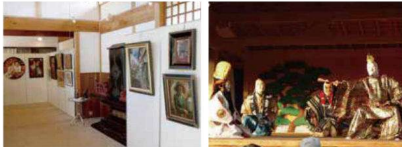
全曇寺日仏造形美術フェスティバル展

※本誌に掲載している情報は、一部インターネットなどに掲載されている文献をもとに編集しておりますので、地域・風習等により異なる場合がございます。